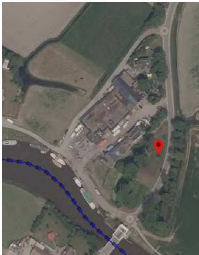
Het fabriekscomplex ten zuiden van Ee