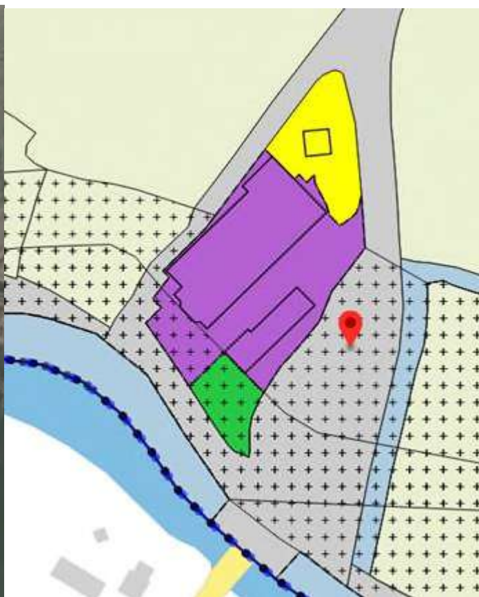
De verschillende bestemmingen van het fabriekscomplex

Het principeverzoek beoogt de ontwikkeling van een deel van het steenfabriekcomplex. Dit op initiatief van de eigenaar van het deel van het fabriekscomplex (op onderstaand kaartje rood gekleurd).