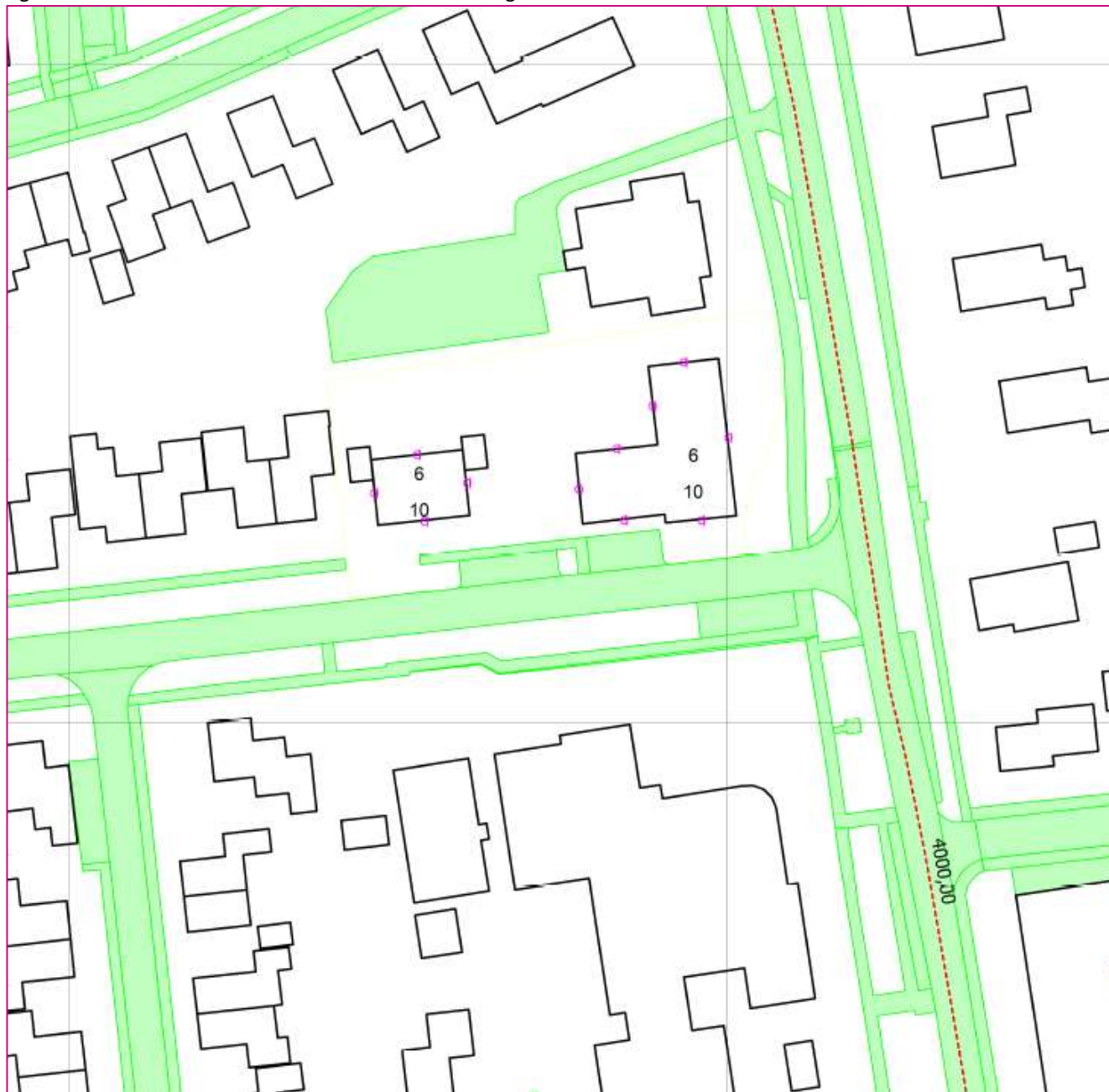
Figuur 2: overzicht akoestisch rekenmodel Hantumerweg 36