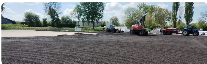
Aanbrengen sporttechnische laag.

De ondergrond voor het kunstgrasveld is bijna gereed. De grasmat ligt al klaar om uit te rollen. Aansluitend plaatsen we de hekwerken en ballenvangers en stellen we de verlichting af. Als alles volgens planning verloopt, dan is het veld in week 21 of 22 klaar voor gebruik.