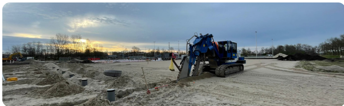
Aanleg drainage tennis- en padelbanen.

Op dit moment werken we aan de ondergrond voor de tennisbanen en de verharding er omheen. De bouw van het clubhuis verloopt volgens plan. De bedoeling is om de banen en het gebouw tegelijk klaar te hebben voor gebruik.