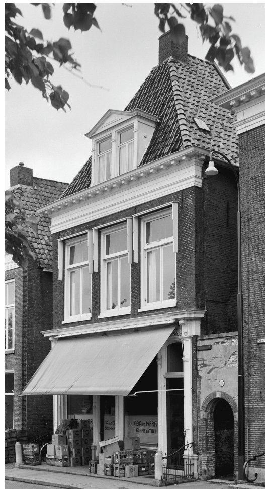
archieffoto ca. 1950-1960