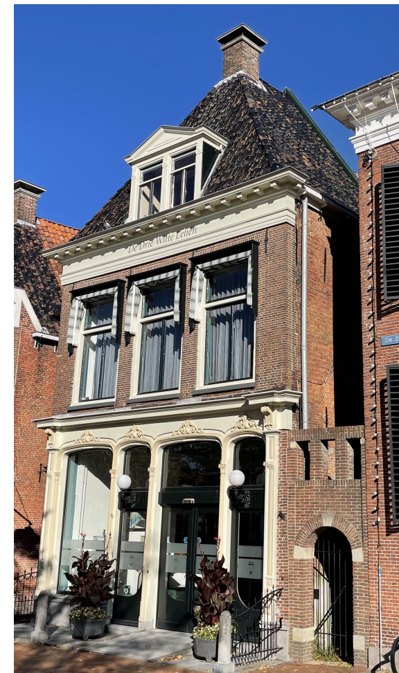
2025 foto huidige situatie